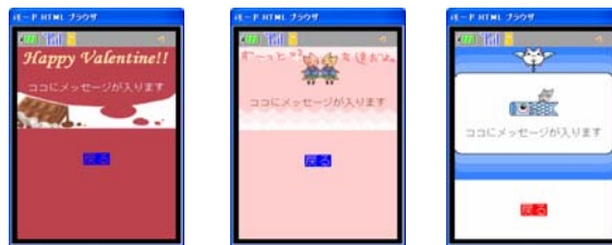
デコメールテンプレート一例

提供デコメールテンプレートを 23 種類から約 100 種類へと大幅に増量いたしました。