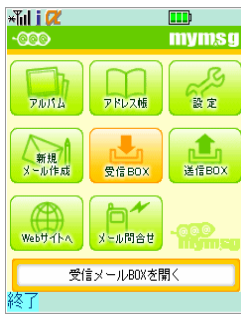
携帯アプリ TOP 画面